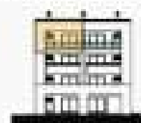
C/ SANT ANDRÉS